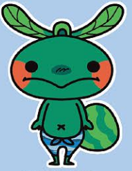
国東市キャラクター さきくん